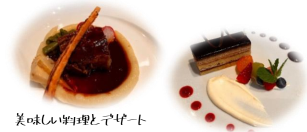
美味しい料理とデザート