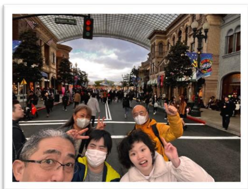
帰り際に記念撮影