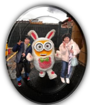
ウサギのミニオンと