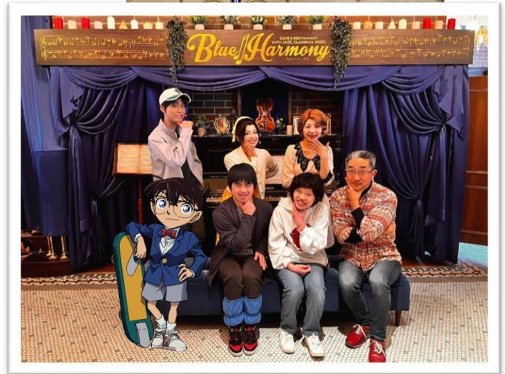
キャストと記念撮影