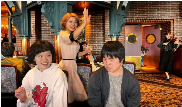
どこかにコナンが… いるわけ???